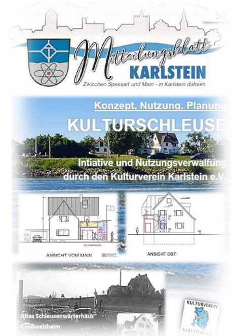
KMB, Dezember-Ausgabe 50/2020

Das Konzept sieht neben barrierefreiem Terrassen-Zugang auch sporadische Bewirtungsangebote, wie Café und Biergarten mit überdachter Außentheke und kleiner Küche vor. Spielmöglichkeiten im Freien für die Kleinen sind vorgesehen. Jugendlichen und Vereinen stehen Räumlichkeiten im Oberschoss als Gruppen-/Vereinsräume zur Verfügung, die ebenso als Medien-/Kreativraum, Probenraum und Bar (Erdgeschoss bzw. Keller) dienen sollen.