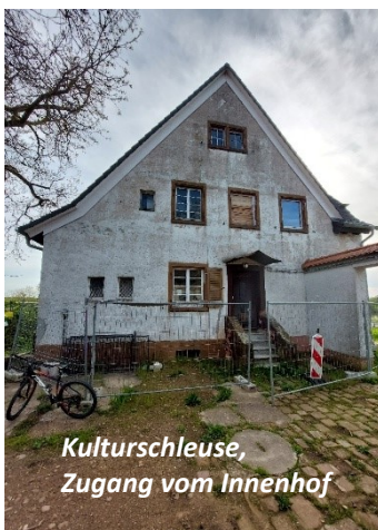
Kulturschleuse, Zugang vom Innenhof

Der mit Fluchttreppe vorschrittmäßig vorgesehene Balkon ist in einer Stahlkonstruktion geplant, die an das Konstrukt der alten Schleuse erinnern soll.